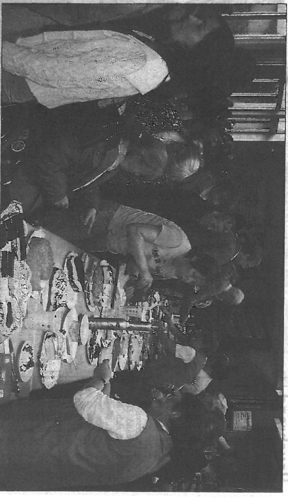
Das Kirchenbuffet der Landfrauen erfreut sich großer Beliebtheit

Eine Kostprobe ihres Könnens geben verschiedene Gruppen. Alle Gruppen verzichten auf Gage. Im Eingangsbereich: Baskets 69 Rollstuhl-Basketballgruppe (11 Uhr), „Doo-Dance Grupp-