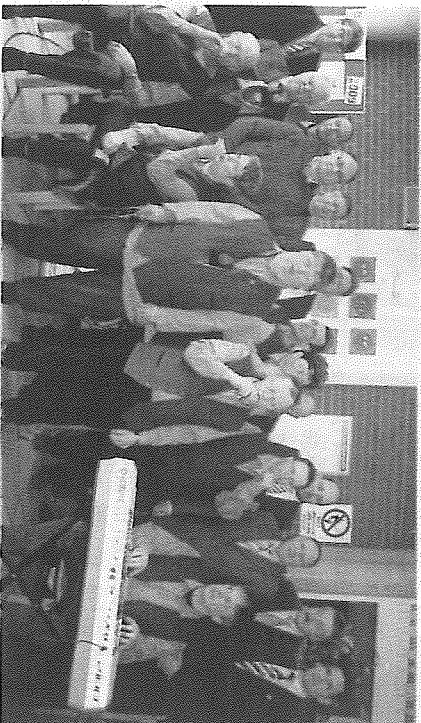
Ein Ständchen für die Spender.