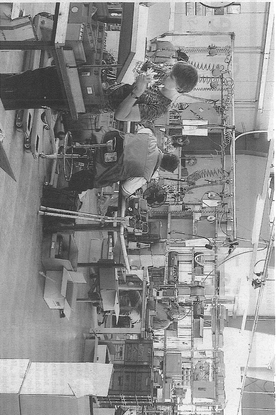
Hier wird produziert: Die Elektroabteilung der Lebenshilfe-Werkstätten mit ihren etwa 40 Beschäftigten wurde im Februar 2001 in eine Industriehalle an der Thyssenstraße verlegt.