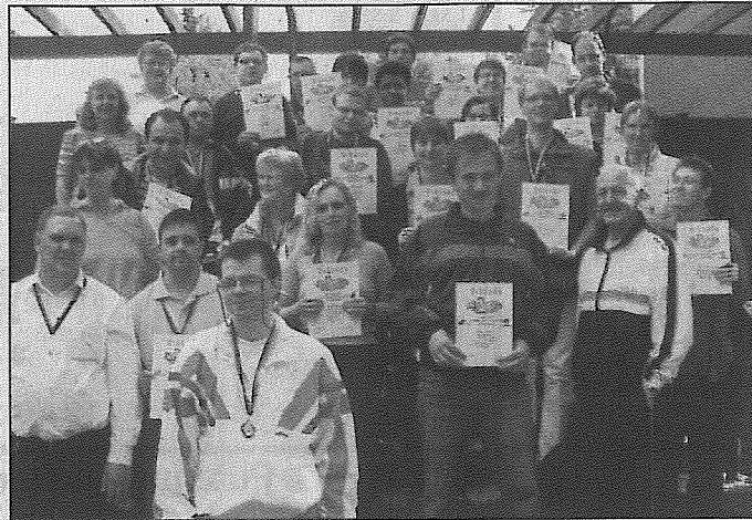
Die Teilnehmer mit ihren Betreuern.